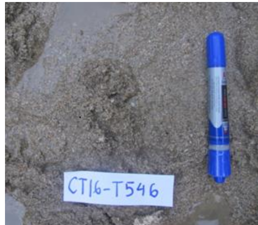
Ảnh 2. Trầm tích cát màu xám, xám phớt vàng